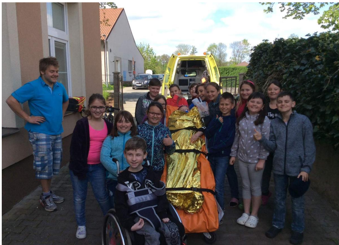
Foto ze Záchranářského dne